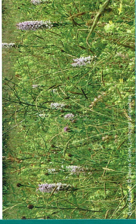
Grote Beemd